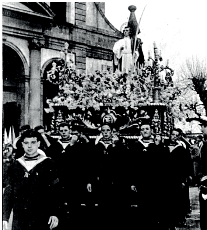
San Juan saliendo de San Julián, años 50

O Venres Santo saíu como o ano anterior, nesta ocasión a choiva permitiu saír á procesión do Santo Enterro.