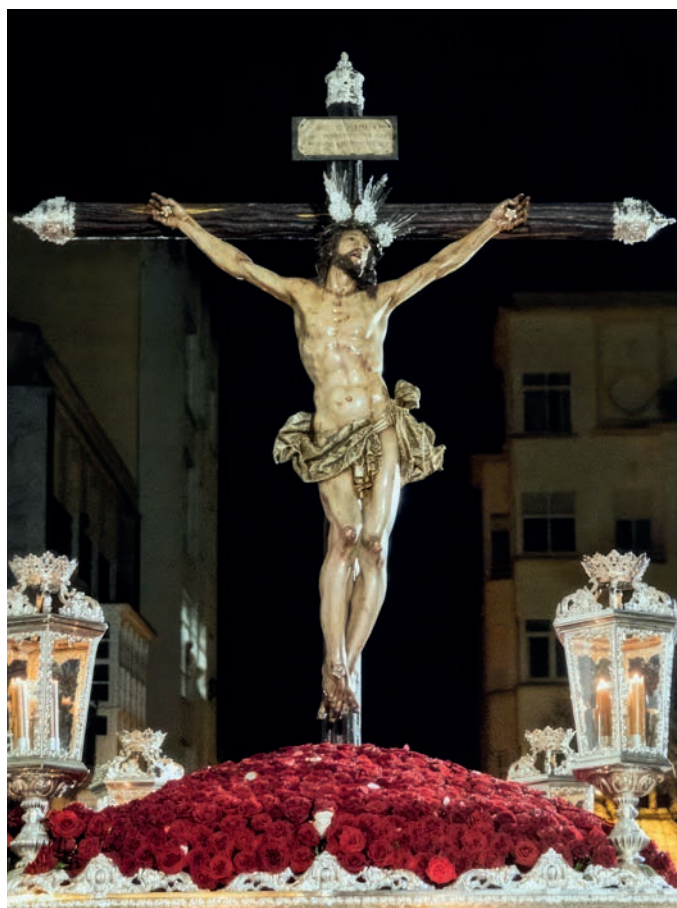
Talla de José Romero

Esta imagen, como se ha expuesto, no se encargó con un fin procesional aunque saliese desde 1946. Con todo, así continuaría hasta principios de los ochenta cuando, debido a su deterioro, se opta por sacar la talla prestada del colegio de las Hijas de Cristo Rey. Finalmente, vuelve a procesionar según dicen “a modo de despedida” en 1998 antes de dejar paso al nuevo Cristo.