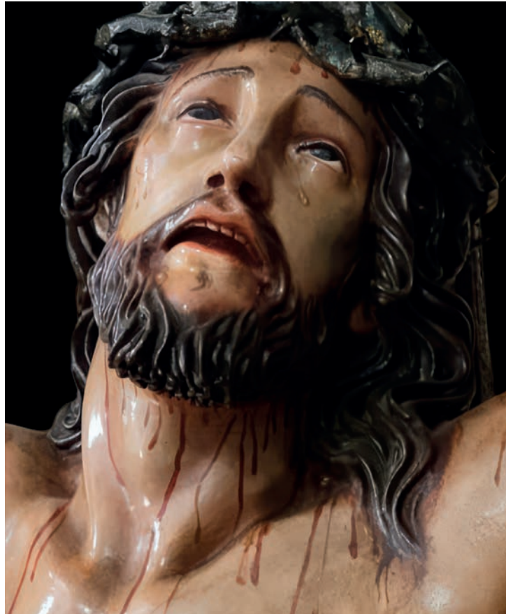
Rostro del Cristo de la Misericordia de José Romero, que procesiona actualmente

La historia de la Cofradía de los Dolores de Ferrol se remonta al siglo XVIII, concretamente al año 1750, cuando se despierta una especial devoción por la Virgen de los Dolores a la cual rinden culto y procesionan por las calles de la ciudad. Aun así, hubo que esperar hasta 1945 para la formación de la Cofradía de Caballeros del Santísimo Cristo de la Misericordia. Esta cofradía estuvo encabezada por