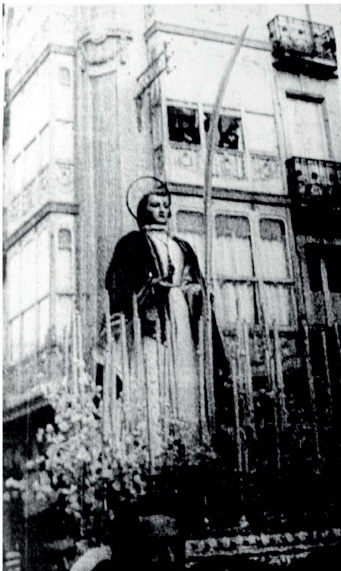
San Juan procesionando en los años 40

El 15 de abril de 1949 a las 16:30 horas parten de la plaza de Dolores (actual plaza de Amboage) los cofrades de San Juan para salir en las procesiones del traslado y Caladiños, en las que acompañaron a San Juan Evangelista y María Santísima de los Dolores.