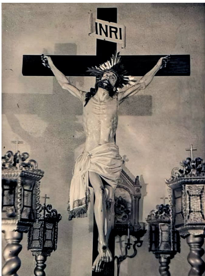
Talla de Baldomero Baño

La imagen es un Cristo vivo que levanta su mirada al cielo exclamando: «Padre, perdónalos, porque no saben lo que hacen» (Lc 23:34). Este momento de perdón es el que da paso a la advocación de Cristo de la Misericordia. Precisamente al escoger el momento antes de morir este crucificado carece de la herida en el costado, por consiguiente, tampoco se plasma la sangre. Sobre la cabeza ladeada sutilmente a la izquierda reposa una corona de espinas realizada en madera. Tras esta, unas potencias doradas de añadido probablemente posterior. En su rostro destacan los ojos de cristal, así como la boca abierta que deja entrever la dentadura. También es resaltable el paño de pureza con una serie de pliegues con cierto movimiento y con caída de la atadura hacia la derecha.