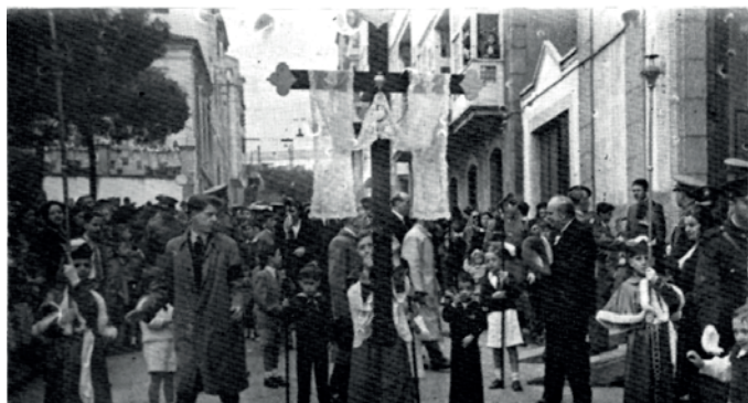
Momento da saída da Procesión do Traslado ao Santo Enterro do ano 1945

La Congregación de los Dolores, encargada por el Concejo de la Villa de Ferrol de la organización de las procesiones del Santo Encuentro y de la función del Desenclavo, pretende hacer una variación en el lugar de celebración, la Plaza Pública. “por lo asqueroso de el”, al ser el sitio habitual del mercado de animales, pescados y verduras.