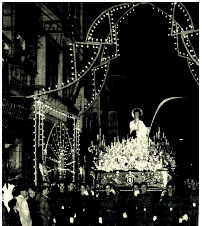
Fotografía de los años 50