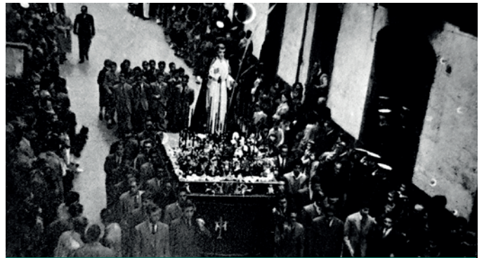
San Juan en una fotografía posiblemente tomada en su primera salida, en el año 49

O 15 de abril de 1949 ás 16:30 horas parten da praza de Dolores (actual praza de Amboage) os confrades de San Xoán para saír nas procesións do traslado e Caladiños, nas que acompañaron a San Xoán Evanxelista e María Santísima de Dolores.